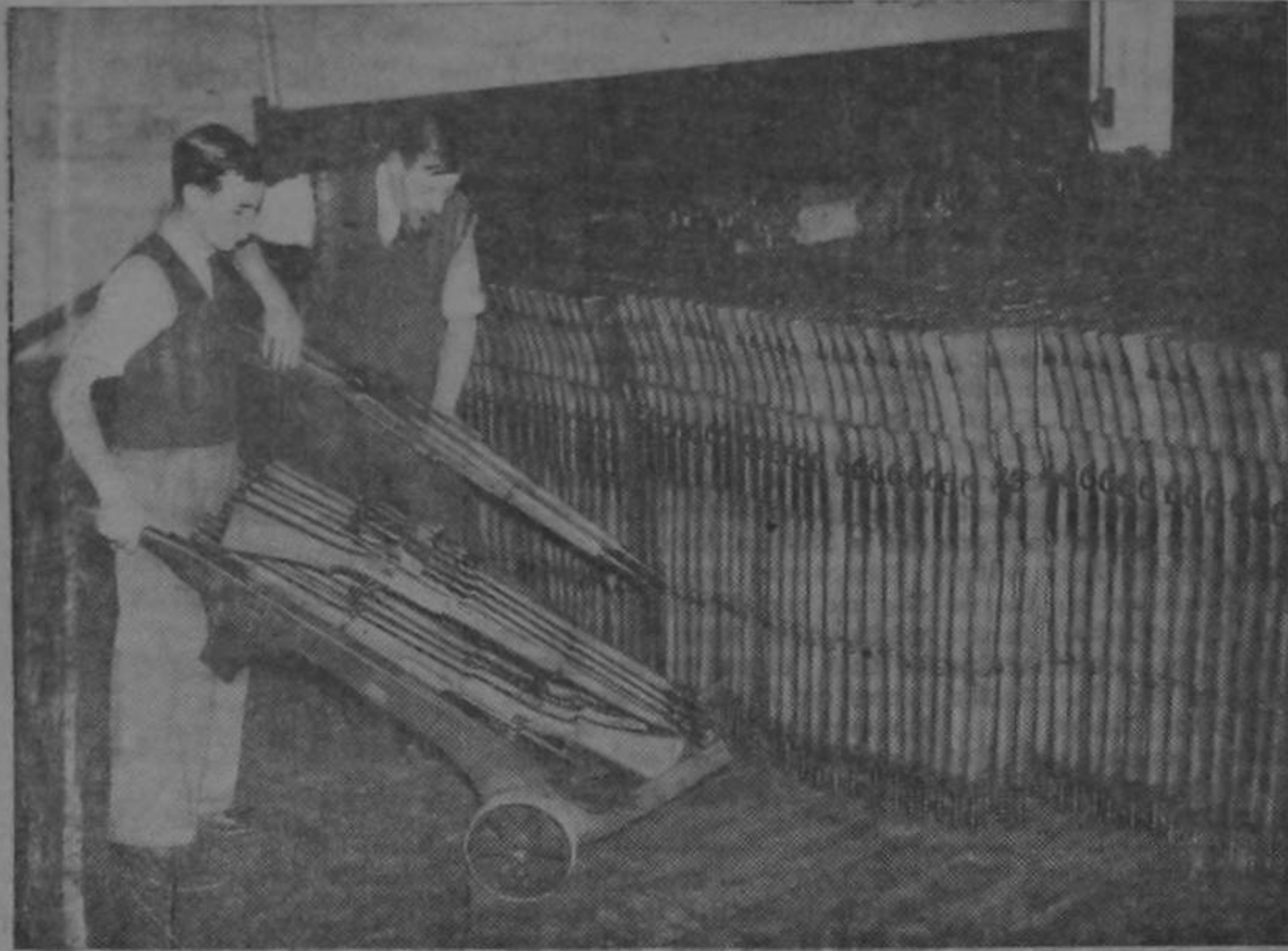
Into a rack the Vickers machine guns and a British small arms factory, and another contribution is made to the hours — a — day munitions effort.