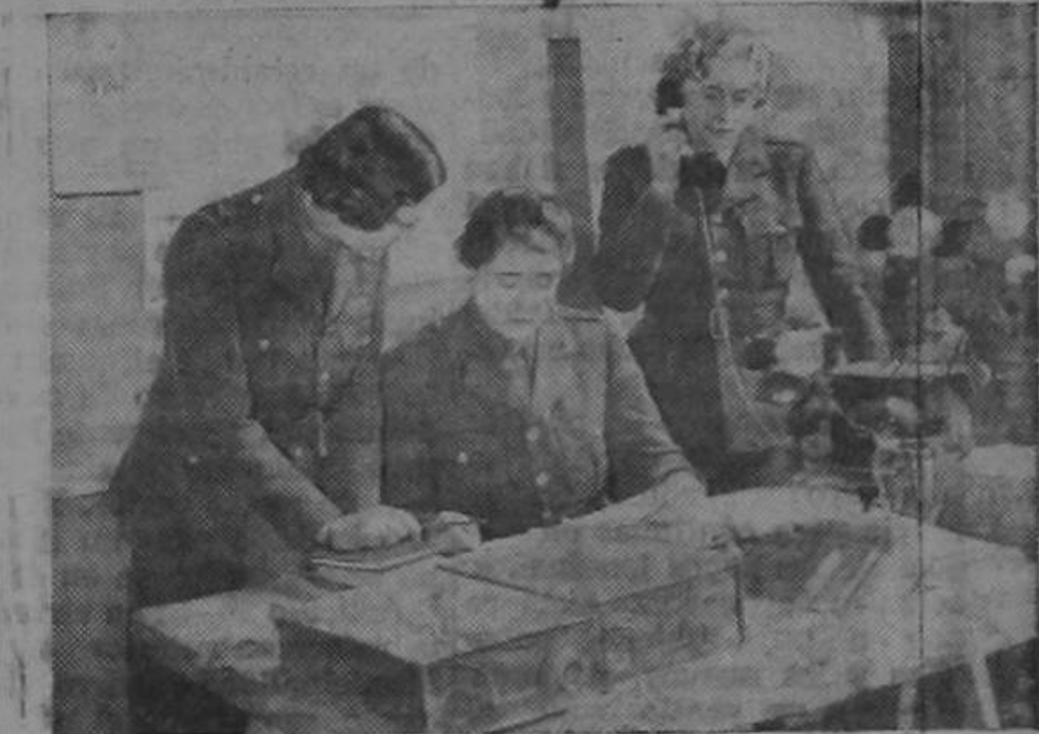
Las organizaciones auxiliares de las mujeres trabajan detrás de los frentes apoyando a los ejércitos en las defensas del Reino Unido.